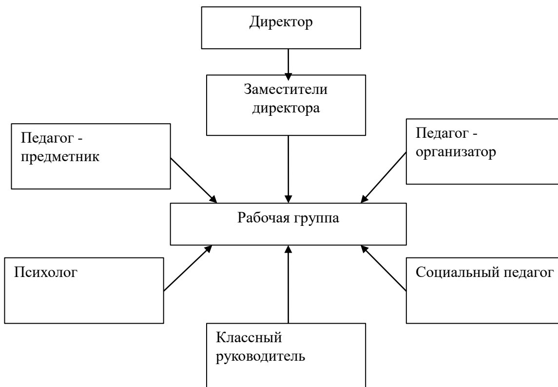
Рис.1 Схема управления адаптацией

Реализация программы вызывает необходимость создания проблемно-творческой группы, введения следующей управленческой схемы взаимодействия участников образовательного процесса, которая будет действовать в период адаптации детей-мигрантов: